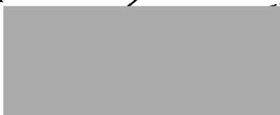
Tabel cu susținătorii propunerii legislative pentru completarea articolului 456 alineatul (2) din Legea 227 din 2015 privind Codul fiscal